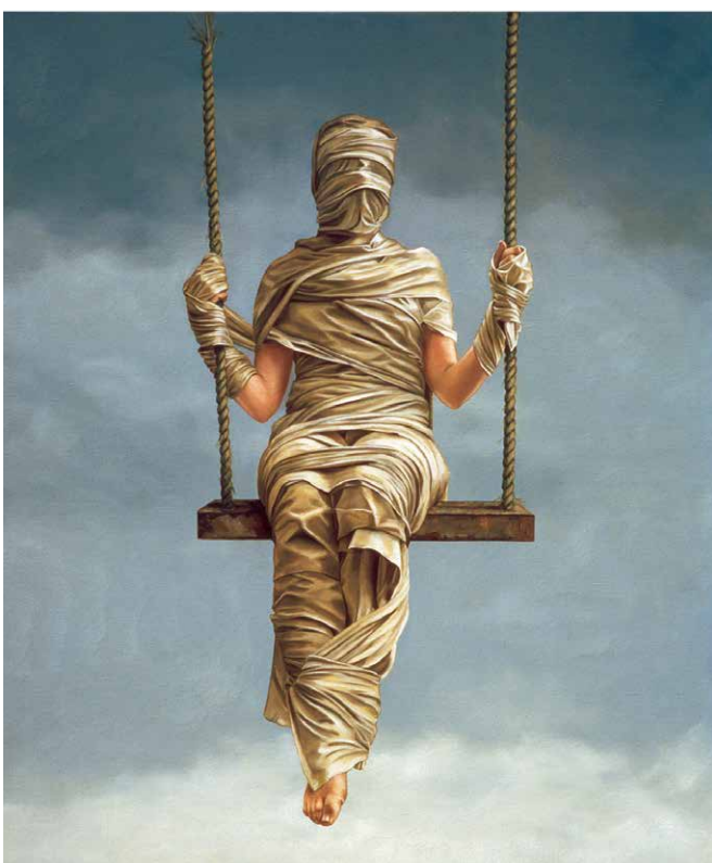
Verbonden vrijheid, 1984, olieverf op doek, 130 x 110 cm

Gelijktijdig met de tentoonstelling verschijnt bij uitgeverij Waanders & de Kunst van auteur Wim van der Beek de publicatie 'Ans Markus – Als ik jou was...'