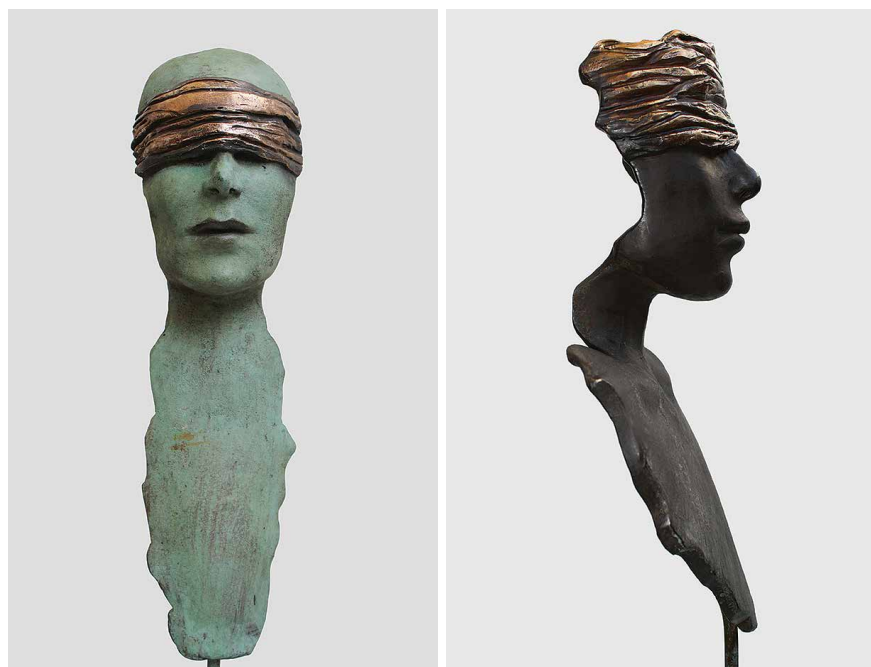
Beelden uit de reeks Kwetsbaarheid, 2011-2015, brons