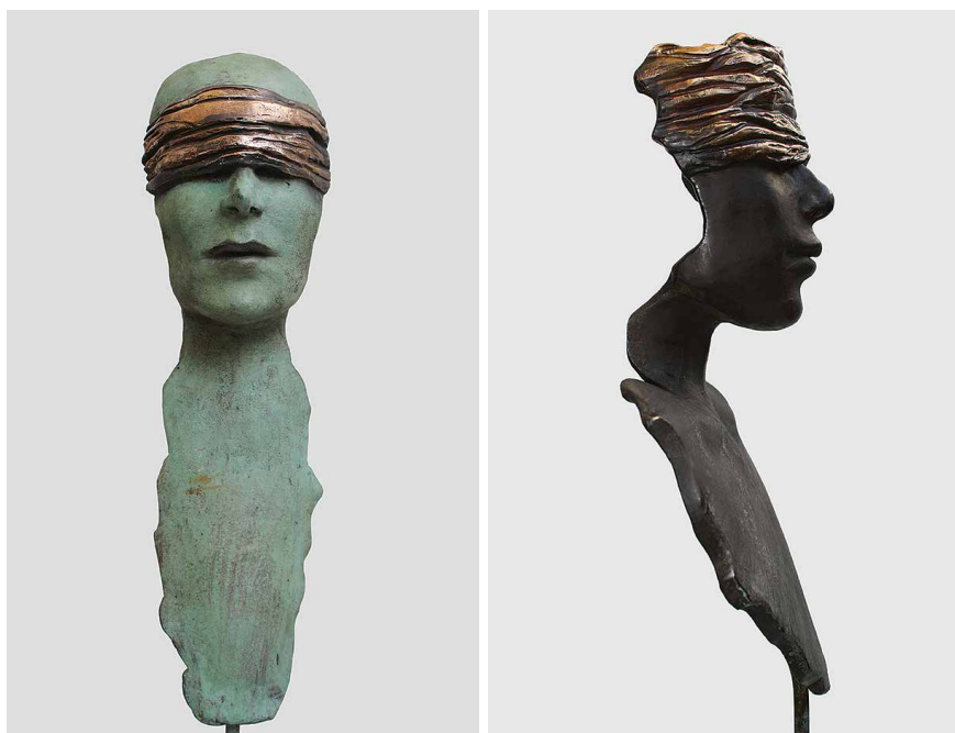
Beelden uit de reeks Kwetsbaarheid, 2011-2015, brons