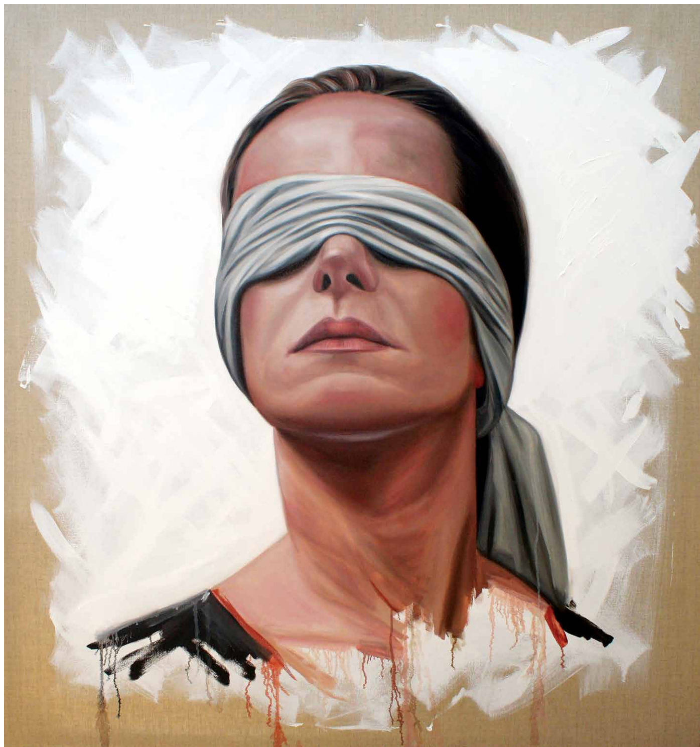
Afgebeeld links: voormalig burgemeester van Amsterdam Job Cohen, 2005, olieverf op doek, 170 x 60 cm. Afgebeeld rechts: Verbonden vrijheid, 2015, olieverf op doek, 130 x 130 cm