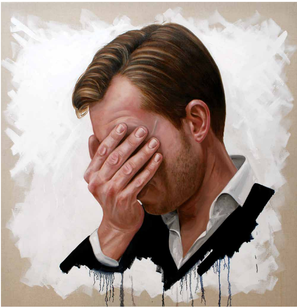
Verborgen verdriet, olieverf op doek, 2014-2015, 150 x 150 cm.